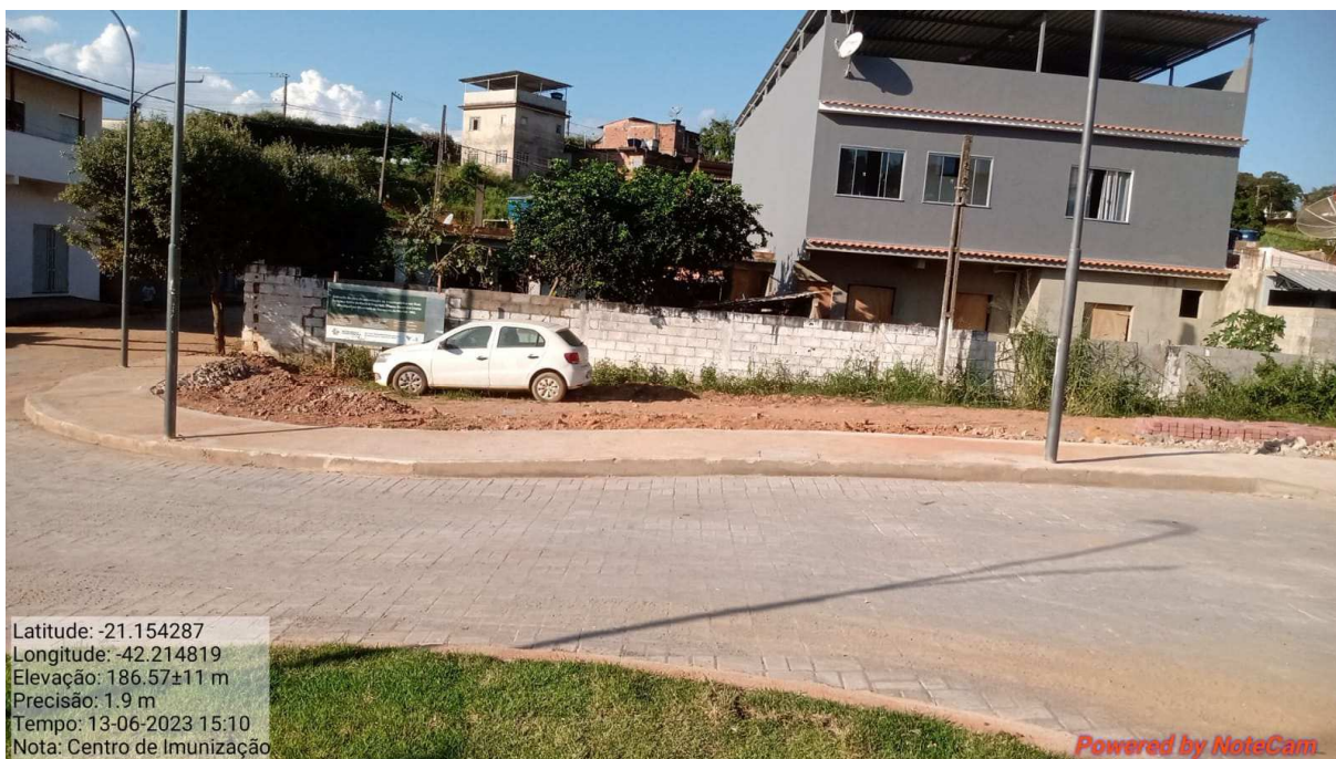
Foto 01: Vista lateral do local onde será construído o Centro de imunização

Latitude: -21.154287 Longitude: -42.214819 Elevação: 186.57±11 m Precisão: 1.9 m Tempo: 13-06-2023 15:10 Nota: Centro de Imunização